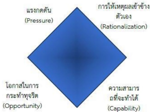
การพัฒนาของทฤษฎีสี่เหลี่ยมทุจริต (Four-sided Diamond)